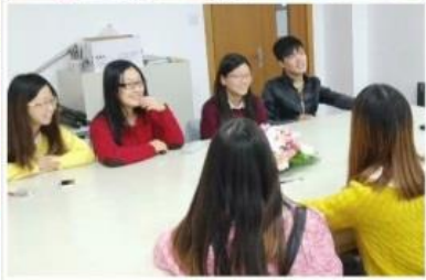
“走近APEC,观亚太之盛会”活动