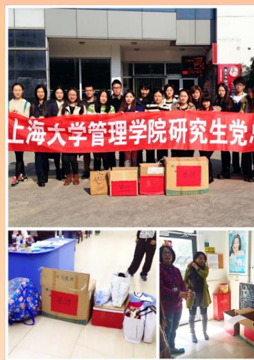
普洱地震募捐活动