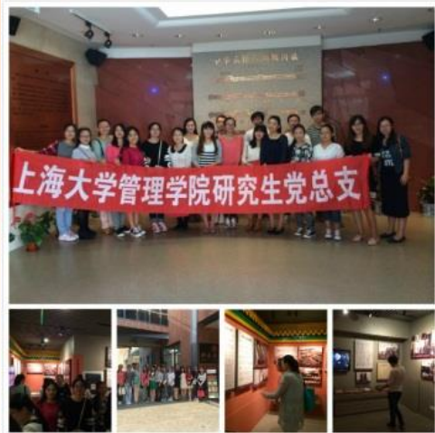
“纪念建党93周年”——参观国歌纪念馆