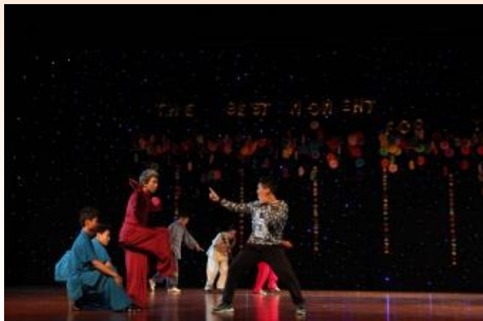
武术《功夫世家》(表演者：体育班武术队)