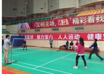
“强健成员体魄，建设健康支部”活动