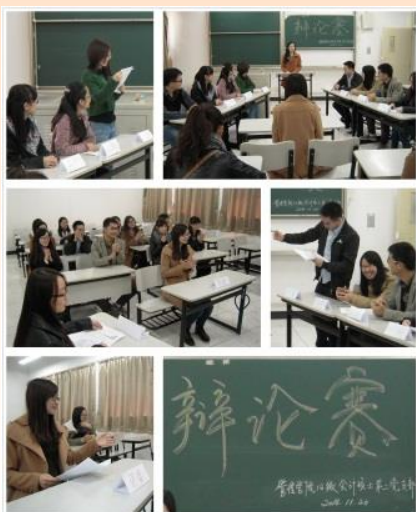
“研究生学习更重要还是实践更重要”辩论赛