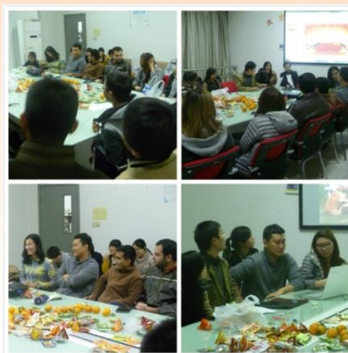
“中泰两国文化民促知识共学习”活动