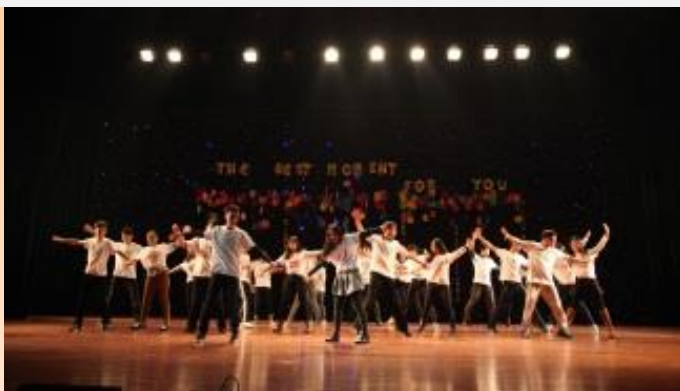
集体舞《Yesterday once more》 (表演者：管理学院学生会干部)