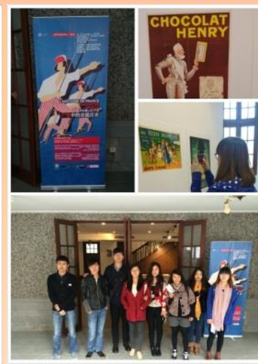
“中法建交50周年”纪念活动