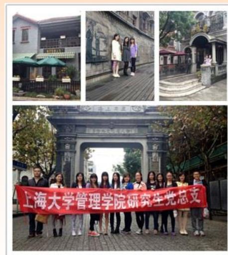
多伦路文化名人街参观活动