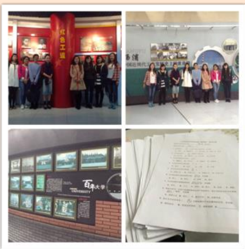
“感受工人运动，重温新民主主义革命”活动