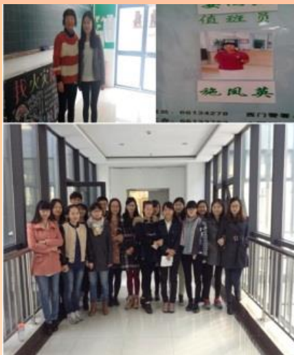
“知电节电，安全用电”活动