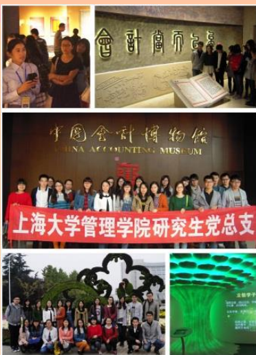
中国会计博物馆学习游