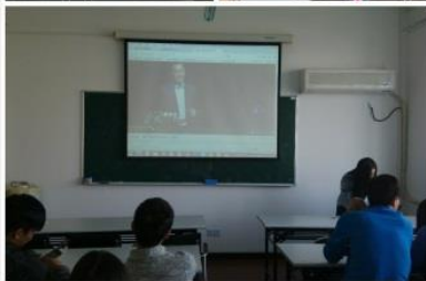
“通向互联网未来的七个路标”主题交流会