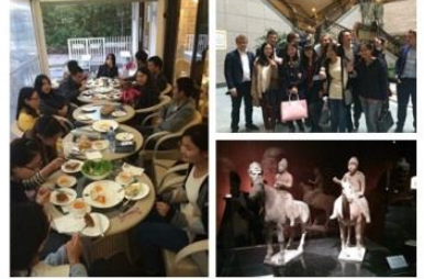
“拓展知识面、助力学术研究”主题活动