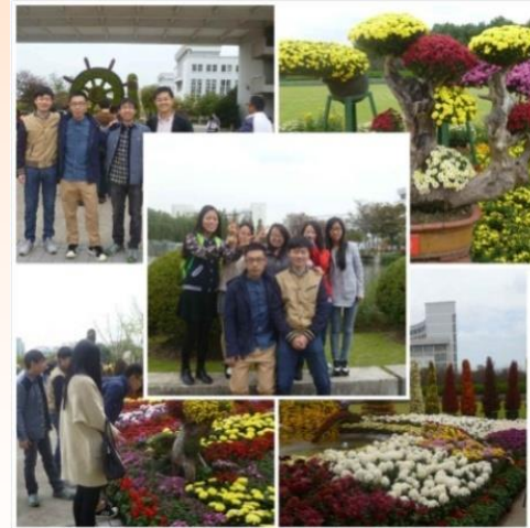
“勤耕十几载，菊香溢上大”活动